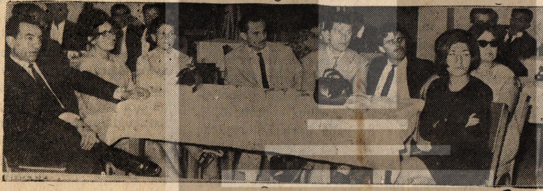
Sendika temsilcileri genel Başkan R. Güvenle birlikte